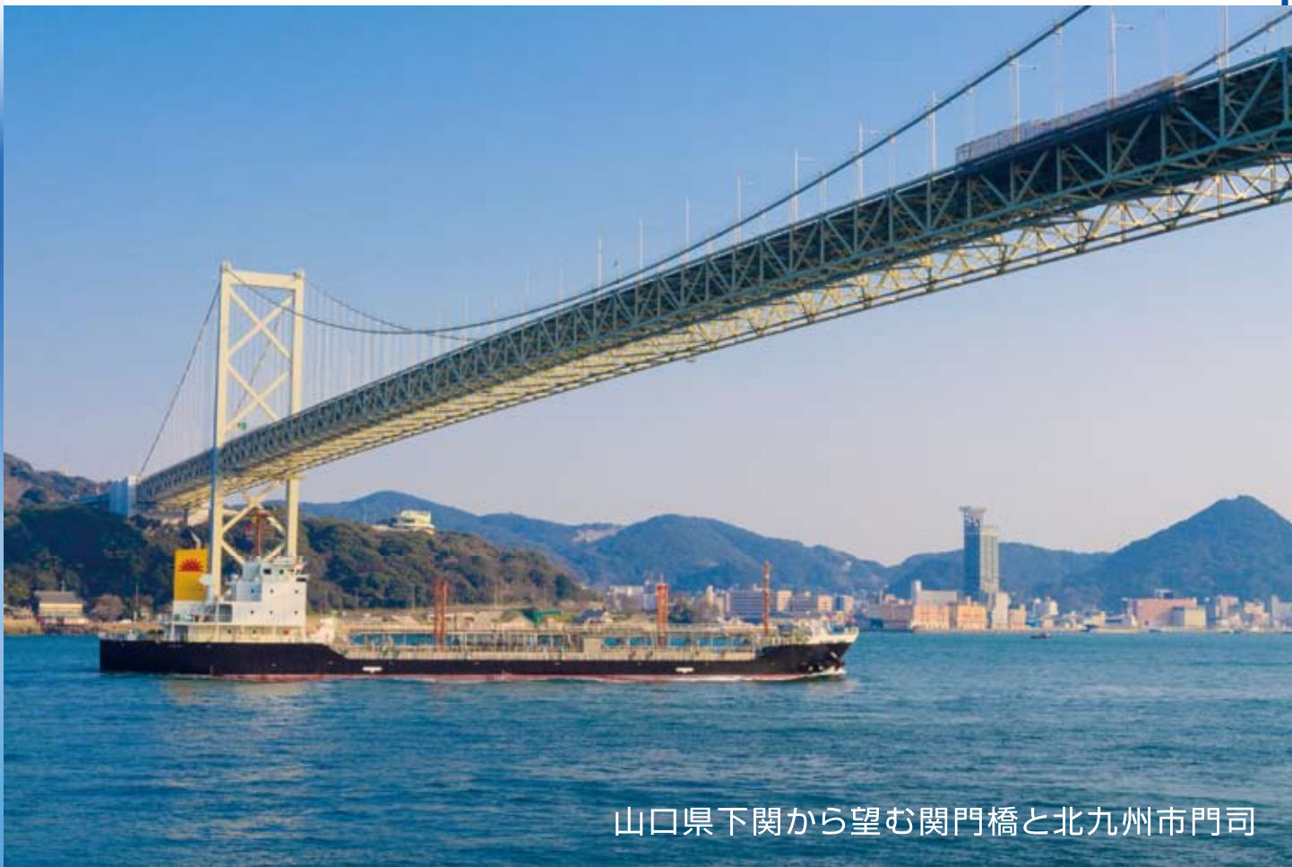
山口県下関から望む関門橋と北九州市門司

「感謝のいけにえを神にささげよ。あなたの誓いをいと高き方に果たせ。苦難の日にはわたしを呼び求めよ。わたしはあなたを助け出す。あなたはわたしをあげよう。」(詩篇五〇篇十四〜十五節) 六月、九州の諸教会を訪問しました。後ろのページで紹介していますが、訪問したいいくつかの教会で会堂の話ががりました。大手企業であれば出店に向けてリサーチをして、商売に有利な場所を確保しますが、教会の場合、借家を借りようとすると、まず教会としての使用は認められないという壁にぶち当たり、さらに限られた予算の中で探していくと伝道には不利な場所へと追い込まれていきます。 会堂建設のときには、もう少し自由な選択ができますが、それでも限られた予算の中で探していくと、必ずしもメイン通りに面している伝道に最適な場所といたるところはなく、奥まったところであったり、中心部から離れたところになってしまっています。そのような条件の整わない中で、牧師や伝道師は生活のために副業を持ちつつ、救われるたましいが起こされるために奮闘しています。 私たちはとかく結果を求めがちです。そのため吟味をしないで世の中の手法を取り入れたりすると、必ずしも主は、私たちがいけにえをただ捧げたかではなく、主へ感謝を捧げること、誠実にお仕えること、そして苦難の時に主を呼び求めることを望んでおられます。伝道には多くの苦難があります。その苦難の数だけ主に助けを求めることができる恵みを喜びたいと思えます。(JBBF国内宣教委員会委員長・榎本昌博)